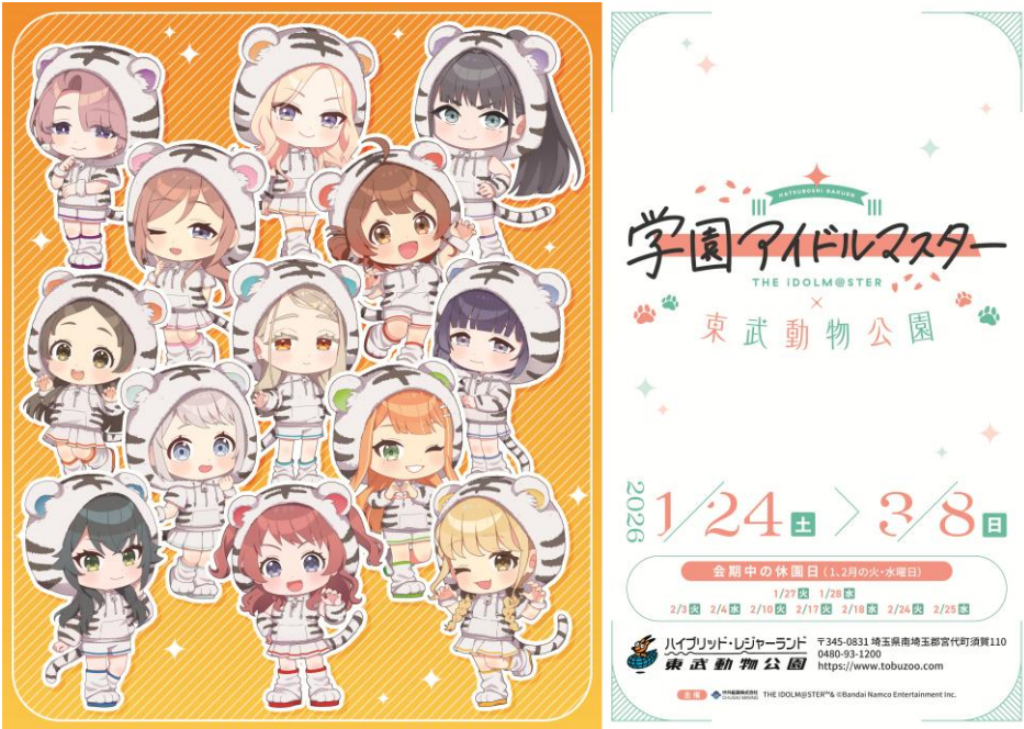
【ホワイトタイガーをモチーフにした、描き起こしミニキャライラスト】

描き下ろしイラストがデザインされた「コラボデザインレプリカチケット（全3種）」と「チケットホルダー」がセットになった『コラボ入園券』を入園ゲートチケット窓口で販売します。 また、『コラボ入園券』をご購入いただいたお客様には、スタンプラリーにご参加いただける「スタンプラリー台紙」をお渡しします。スタンプラリーのスタンプを集めたお客様には「スタンプラリー景品ポストカード」をプレゼントします。