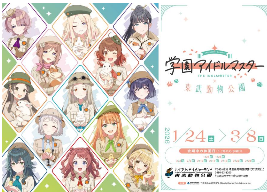
【描き下ろしイラストを使用したメインビジュアル】

混雑緩和ならびに安全確保のため、2026年1月24日（土）・25日（日）の2日間、オリジナルグッズをご購入いただくには、ショップ店舗への入店日時を指定した「ショップ入店整理券付きコラボ入園券」（事前抽選）が必要となります。