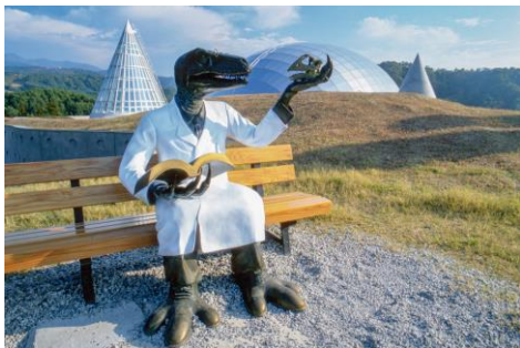
ダイノベンチ恐竜博士