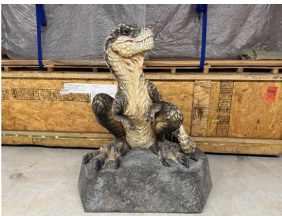
ティラノサウルス幼体模型