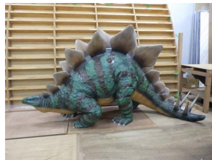
ステゴサウルスFRP模型