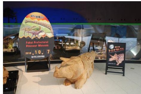
恐竜チェーンソーアート