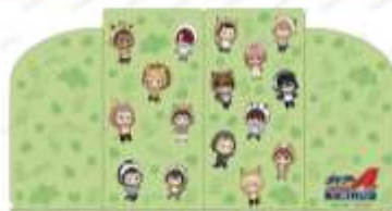
オリジナルチケットホルダー