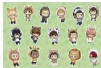
スタンプラリー景品ポストカード