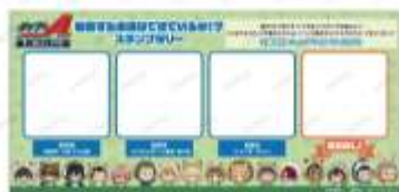
スタンプラリー台紙