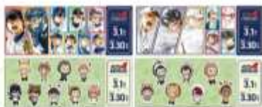
レプリカチケット（全4種）/ランダム