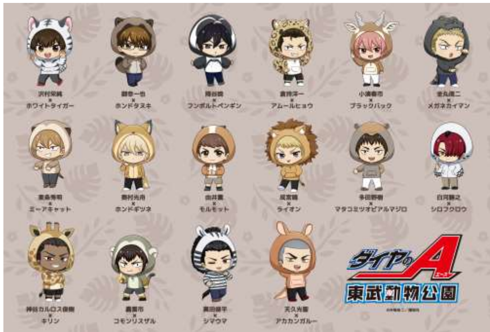
【描き起こしちびキャライラスト一覧】