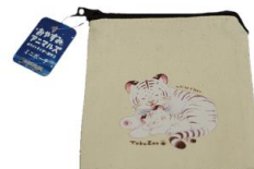
ホワイトタイガー親子 ミニポーチ 880円(税込)