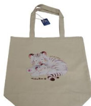
ホワイトタイガー親子 トートバッグ 1,870円(税込)