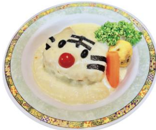
しあわせのオムタイガー