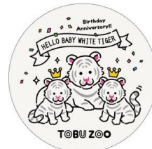
白雲石コースター 800円(税込)