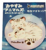
ホワイトタイガー親子 缶バッジ/マグネット 550円(税込)