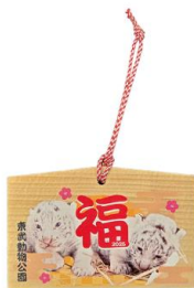
ホワイトタイガーの赤ちゃん 絵馬 550円(税込)