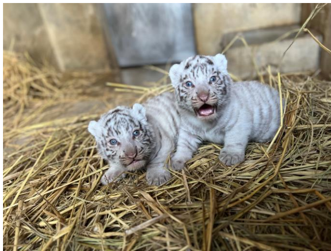
左長男、右次男（12月10日撮影）

展示場練習は、ホワイトタイガーの親子が一般公開同様の環境に慣れてもらうために実施するものであり、12月19日（木）から従業員が観客役となり練習してきましたが、当日来園されたお客様にも、練習のお手伝いをしていただきたく、12月25日（水）よりWEBにて観客役を限定数で募集します。