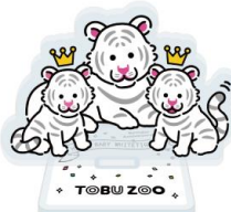
アクリルスタンド 600円(税込)