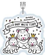
アクリルキーホルダー 550円(税込)