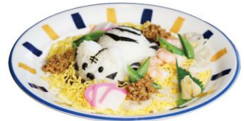
ホワイトタイガーちらしめでタイガー