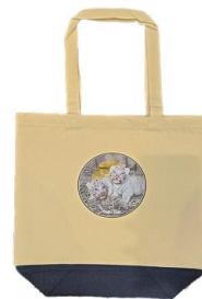
ホワイトタイガーの赤ちゃん トートバッグ 2,200円(税込)