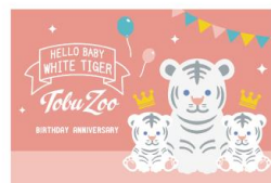
ポストカード 100円(税込)