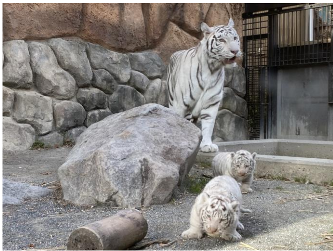
展示場練習の様子（12月21日撮影）