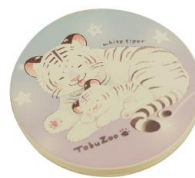
ホワイトタイガー親子 吸水コースター 990円(税込)