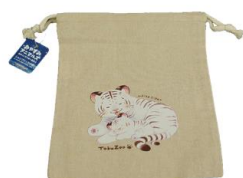
ホワイトタイガー親子 シャブリック巾着 1,430円(税込)