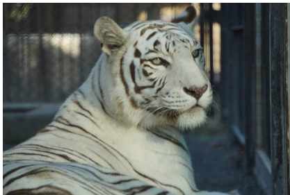
名 前：カーラ 性 別：メス 生年月日：2005年8月7日