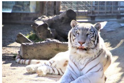
名 前：スカイ 性 別：オス 生年月日：2013年3月16日