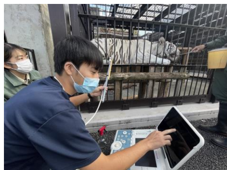
2回目のエコー検査の様子 (10月21日撮影)