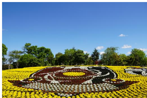
コラボ花壇の様子【4/25（木）】

また、5月18日には、普段サッカーに触れる機会が少ないお客様にも浦和レッズ・埼玉スタジアムの雰囲気をお楽しみいただけるよう「キックターゲット」や浦和レッズのマスコットキャラクター「レディア」のグリーティング等のコラボイベントを開催します。遊園地・動物園とともに、浦和レッズコラボをお楽しみください。