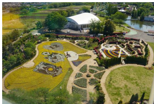
観覧車からの様子【4/25（木）】