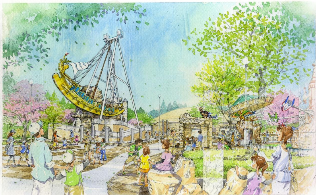
新プレジャーランドイメージデザイン①

新アトラクション「ゴールデンシップ～リバイブ～」は、同エリア内の既存アトラクション「ジャングルファイター」、「ゴッド・スインガー～オーウェ～」と同様、オリジナルのストーリーがあり、本エリアの完成により、個々のストーリーが繋がり、新たな物語が始まります。