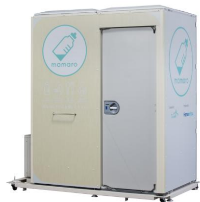
〔屋外型ベビーケアルーム（イメージ）〕