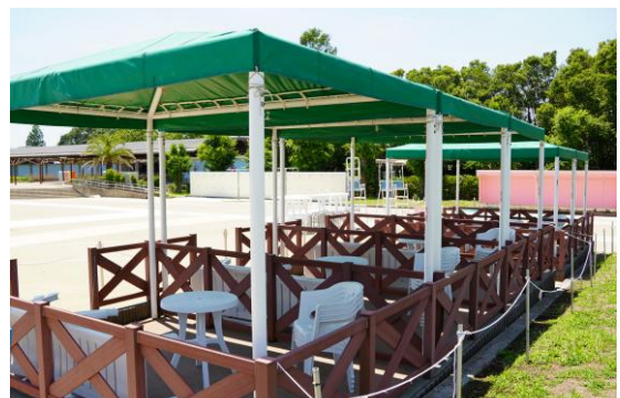
[有料ロイヤルシート席]