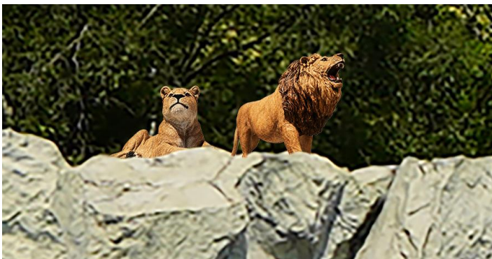
〔動物モチーフ（イメージ）〕

プールエリア一帯の装飾を「SAFARI COAST」をテーマに一新。まるで大自然のサファリに飛び込んだかのような動物たちのモチーフや装飾がエリアを彩ります。また、乳幼児をお連れの方ファミリーにも心から安心していただけるよう、プールエリア内に授乳やおむつ替えができる「屋外型ベビーケアルーム」を導入。さらに、「冷房完備の更衣室」を新設し、泳いだ後の着替えや、お子様のお世話も涼しく快適に行うことができます。