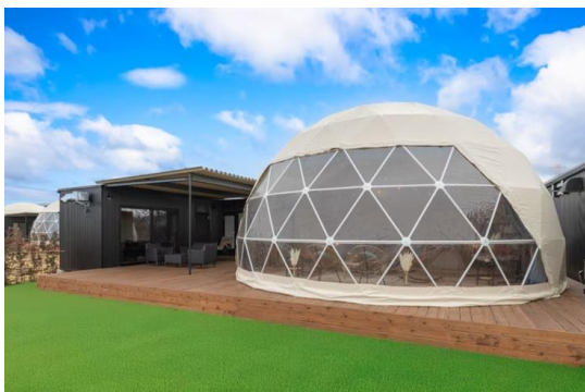
[プライベートガーデンドーム]