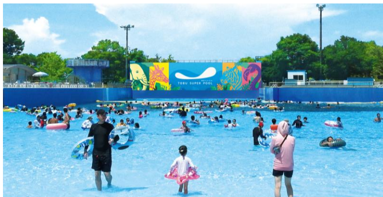
[波のプール（イメージ）]